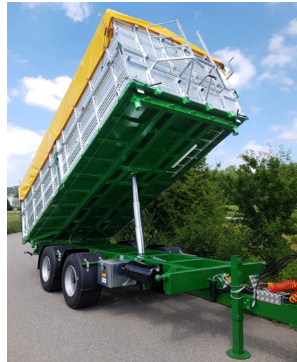
TS 190/210 - 19/21 To. 560 x 245 cm - 18.1 m 3