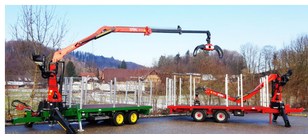
TF-K 190 - 19 To. - 560 x 250 cm Z-Kran/Z-grue 7.5 m/to + div.