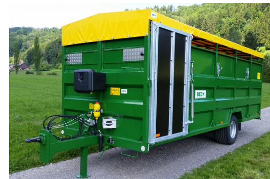
EV 80/100/120 - 8/10/12 To. in: 460/520/560/600/720 x 225 cm