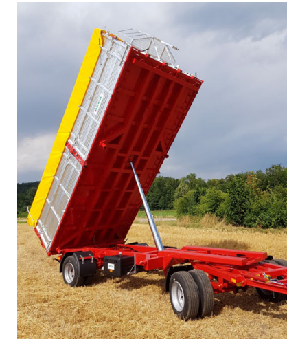
ZN 180/181 - 18 To. - 520/560 x 245 cm - 17.0/18.1 m 3 Bsp. Sonderkonstruktion mit Zwillingsreifen / Ladehöhe: 105 cm