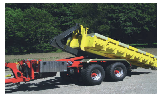
Hakengeräte Systèmes multibennes