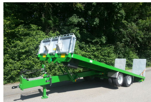
TA-S 160/190/210 - 16/19/21 To. 650/700/750 x 250/255 cm hydr. absenkbar / basculante