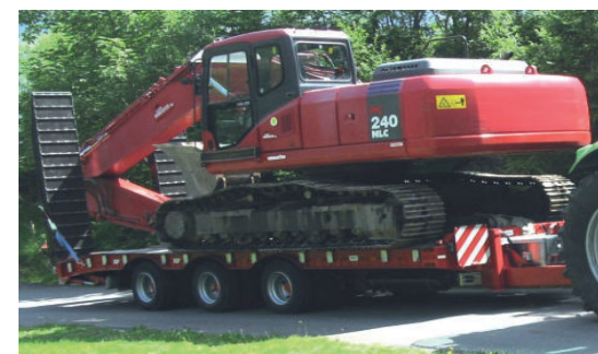
Schwerlastanhänger Remorques à convois exceptionnelles