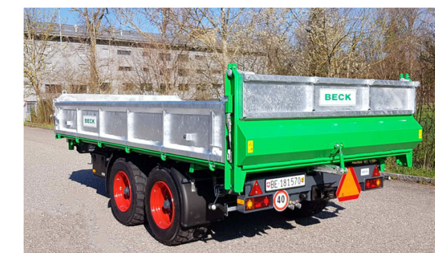
TS-B 160/190/210 - 16/19/21 To. 480/520/560 x 250 cm + div.