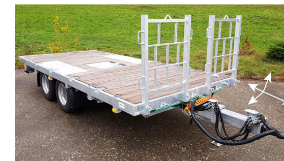
TA-F 160/190/210 - 16/19/21 To. 610/750/820 x 250/255 cm mit hydr. Schwenk- + Auszugsdeichsel