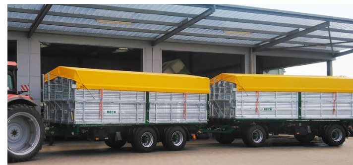
TS 210 - 21 To. - 560 x 245 cm - 18.1 m 3 ZN 180 - 18 To. - 520 x 245 cm - 17.0 m 3