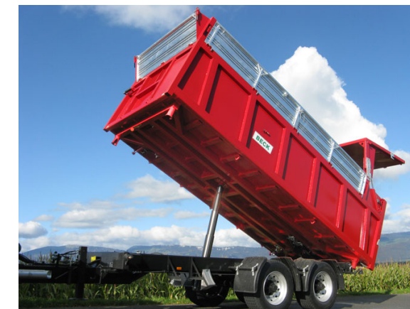
TM 210/230 - 21/23 To. - 620 x 255 cm 125 + 60 cm (ca. 26.0 m 3 ) + div.