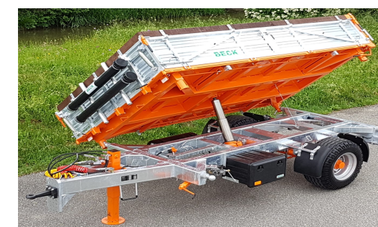
Kommunalanhänger Remorques communales