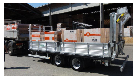
Bauanhänger Remorques constructions