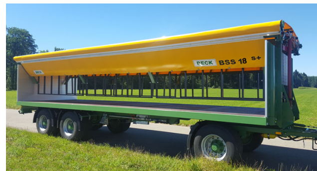
DT 240 - 24 To. 860/1010 x 255 cm mit BSS 18 S+