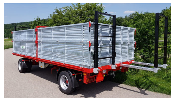
ZM 160/180/181 - 16/18 To. 560/610/650 x 245 cm Option: Heckauszug