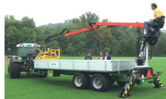
Spezialanhänger Remorques speciaux