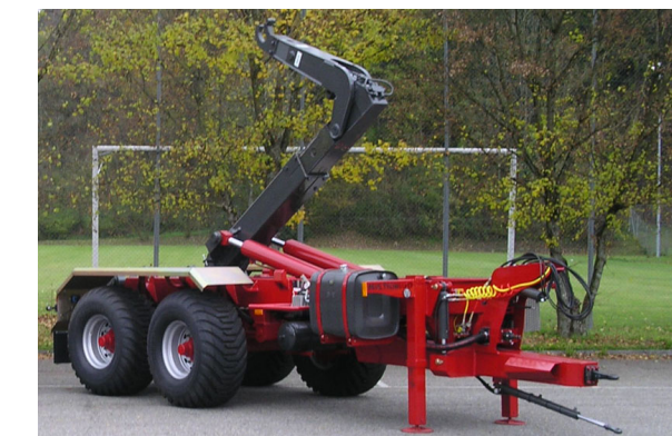
THG 21/23 - 21/23 To. Container 580-720 cm