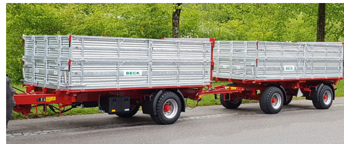
EN 100 - 10 To. - 420 x 230 cm - 10.0 m 3 ZN 160 - 16 To. - 500 x 230 cm - 12.3 m 3