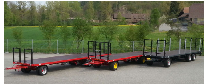
DT 180/182/240/242 - 18/24 To. 860/1010 x 250/255 cm