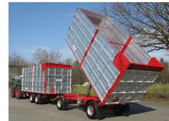
TS 211 - 21 To. (! 33.4 m 3 ) ZN 181 - 18 To. (+ ! 29.8 m 3 = 63.2 m 3 ) hydr. Heckwand - porte hydr.