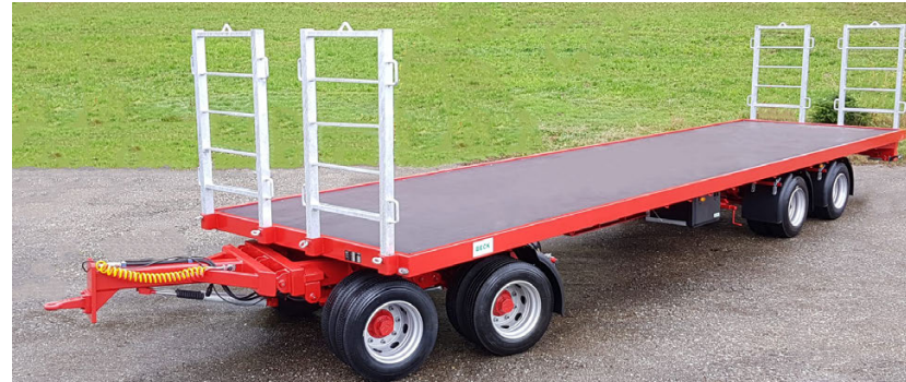
VT 320 - 32 To. - 1010 x 250/255 cm