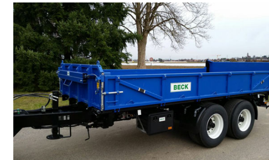
Gartenbauanhänger Remorques horticoles