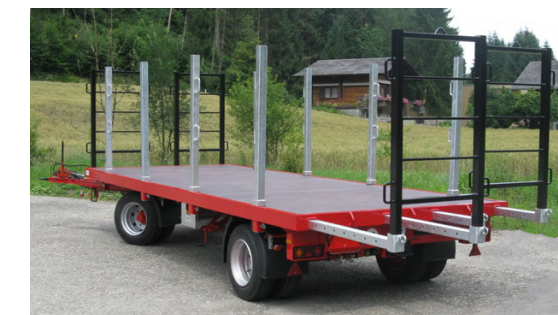
ZT 160/180 - 16/18 To. 610/750/820 x 250/255 cm Option: Heckauszug + Rungen