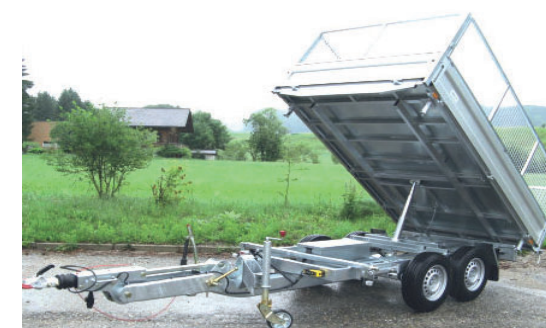
Autoanhänger Remorques autos