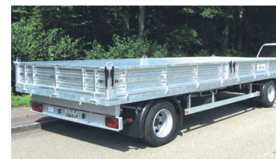
Transportanhänger Remorques routières