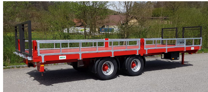
TA 160/190/210 - 16/19/21 To. 610/750/820 x 250/255 cm mit Option: BOX-TRAILER